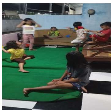
Gambar 5. Permainan Peran untuk melihat nilai Nasionalisme Kemerdekaan