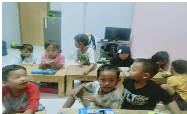
Gambar 2. Kegiatan awal Sebelum Materi

Ketiga, Peran sebagai Motivator: Tutor dapat mendorong siswa melalui berbagai cara, seperti membuat materi pembelajaran yang disukai siswa, memberikan arahan tentang pentingnya membaca, berinteraksi dengan teman siswa, dan menerapkan literasi adab, yaitu dengan terus mengingatkan siswa tentang hal-hal yang boleh dan tidak boleh mereka lakukan. Selain itu, memberikan motivasi dan mengingatkan untuk mempertimbangkan apa yang telah dipelajari selama setiap pertemuan.