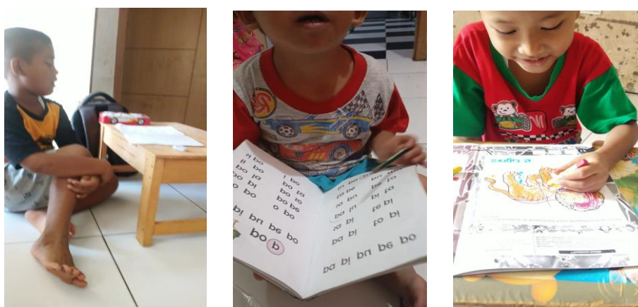
Gambar 1. anak membaca dan mengerjakan materinya sesuai tingkatannya

“Sebagai Tutor Bimbingan Vauz, Tutor Hani menjelaskan “Bahwa Bimbingan Belajar Vauz menjelaskan dan memberikan materi sesuai umur dan kebutuhan siswa, setiap siswa memiliki kemampuan dan daya tangkap masing-masing dan setiap anak mendapatkan materi sesuai kemampuannya.”