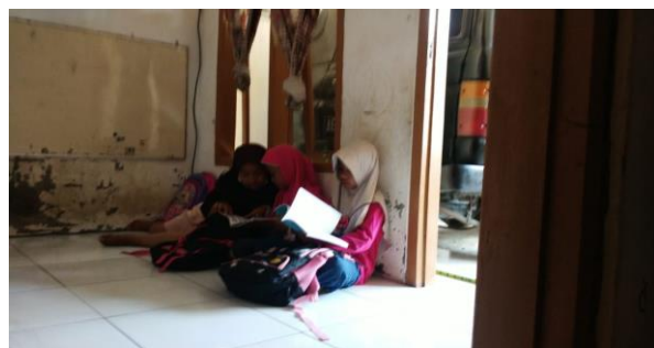
Gambar 4. Sarana belajar dan bermain Bimbingan Belajar Vauz

Kelima Peran evaluator dilakukan dengan menilai perilaku dan sikap anak belajar dengan menggunakan pendekatan bimbingan belajar anak.